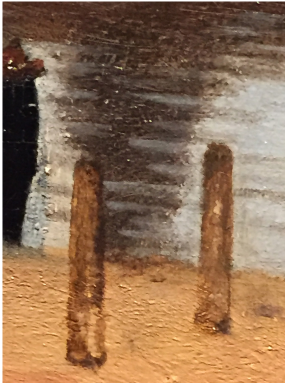
Fragment onbekende schilder

Eveneens op de meest ondeskundige manier is geprobeerd om met een tiental futloze grijze verfstreepjes tussen de paaltjes golfjes te schilderen. Deze verfstreepjes, die geen deel uit maken van de lange doorlopende golflijnen in het water, liggen los op de ondergrond en enkele ervan raken zelfs de binnenkant van de paaltjes.