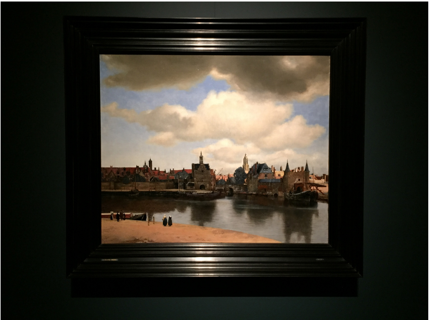
Gezicht op Delft, Johannes Vermeer, Mauritshuis