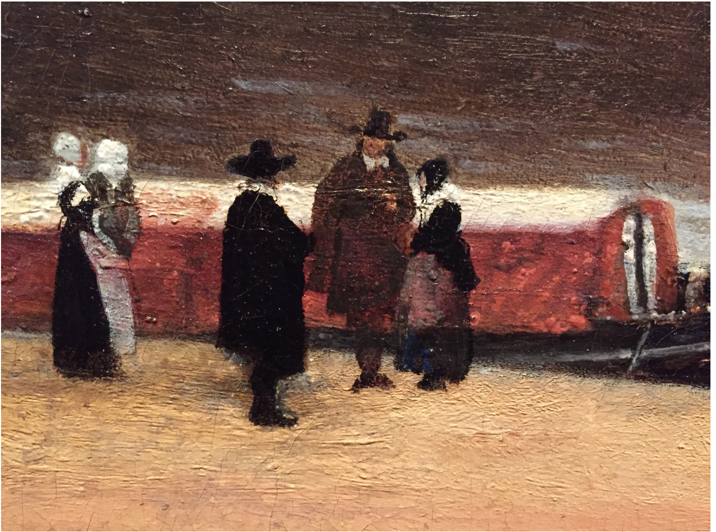
Fragment onbekende schilder