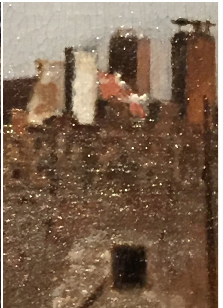
Fragmenten Johannes Vermeer