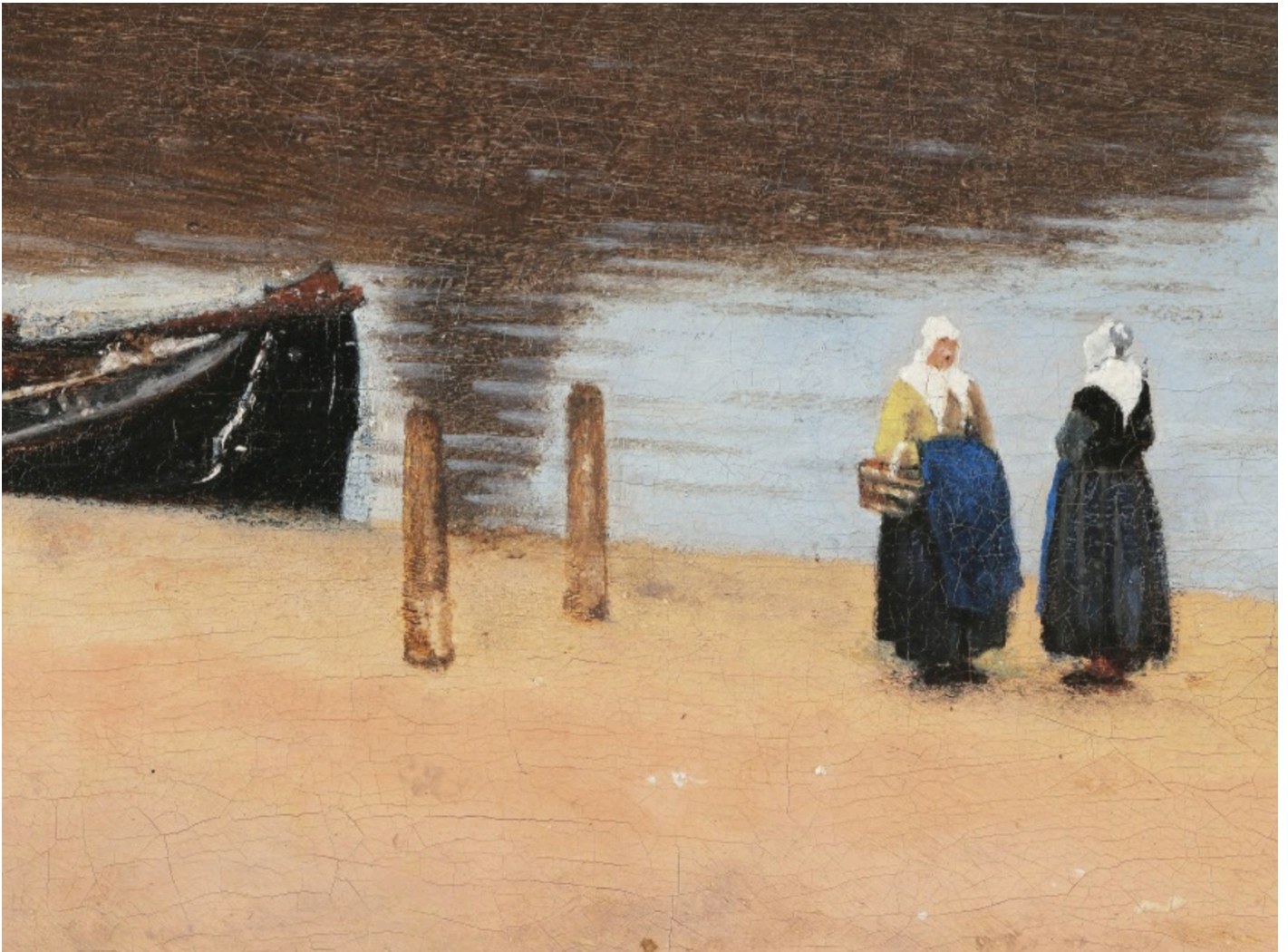
Fragment onbekende schilder