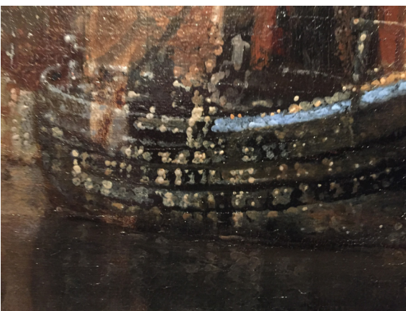
Fragment Johannes Vermeer

Meer dan een halve eeuw geleden zag ik voor het eerst het Gezicht op Delft . Sindsdien ga ik bij bezoek aan een tentoonstelling in het Mauritshuis altijd eerst naar dit schilderij, omdat het, hoe vaak ik het inmiddels ook gezien heb, altijd weer even indrukwekkend is.