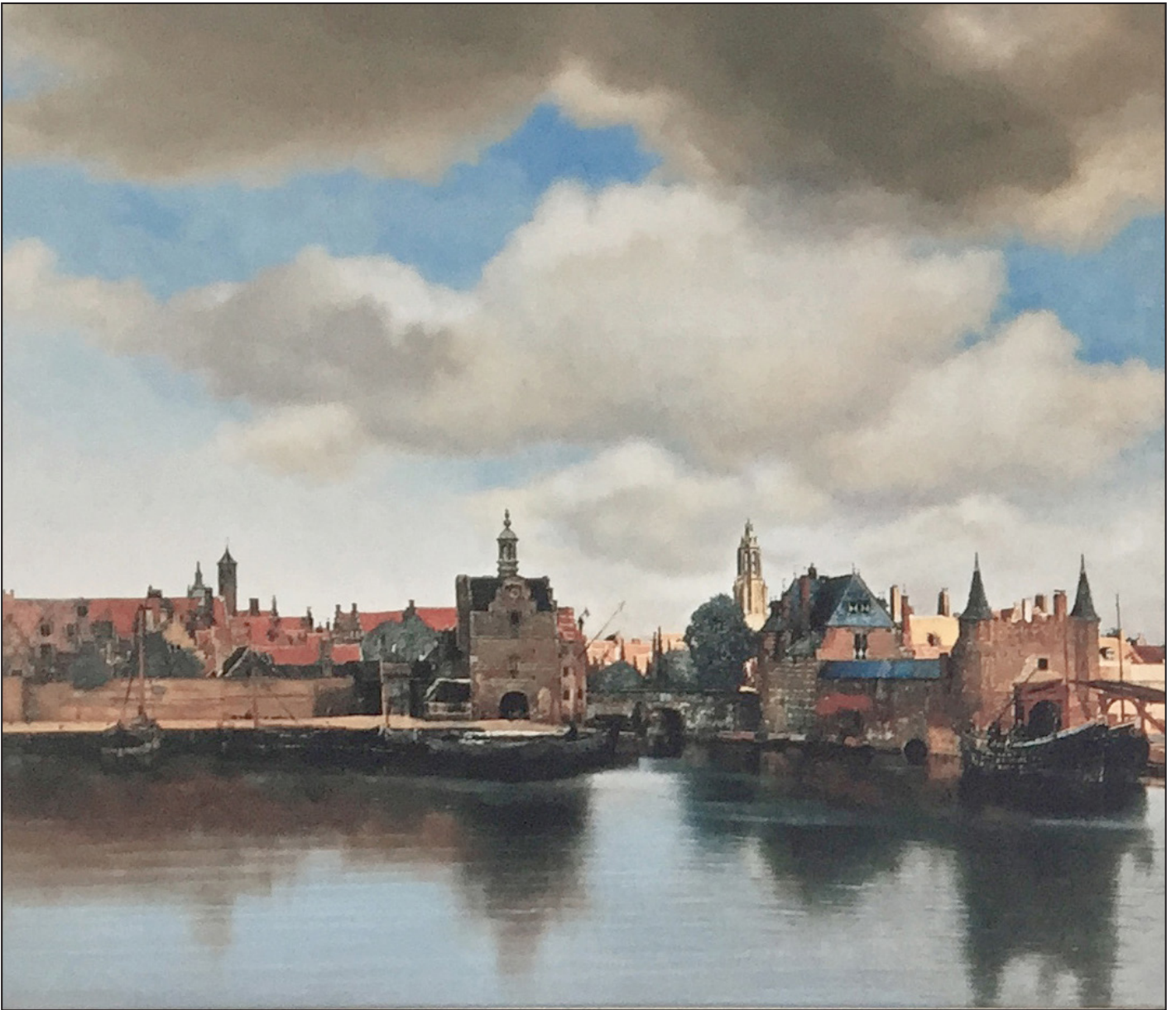
Licht op Delft, geschilderde reconstructie, Ton van Os