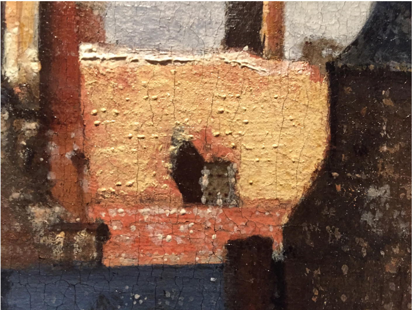
Fragment Johannes Vermeer

Als schilder heb ik me lang afgevraagd hoe het mogelijk is dat een zo groot kunstenaar dit ene deel van zijn meesterwerk zo opvallend slecht heeft kunnen schilderen. De schildertechniek komt hier niet in de buurt van zijn trefzekerheid en zijn verfijnde schilders-handschrift. Even onacceptabel is hoe de diagonale voorgrond detoneert in de statige compositie van het stadsgezicht.