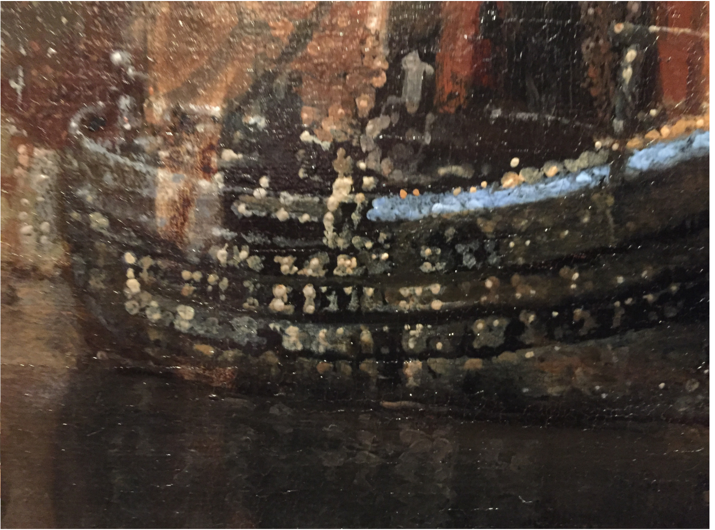
Fragment Johannes Vermeer