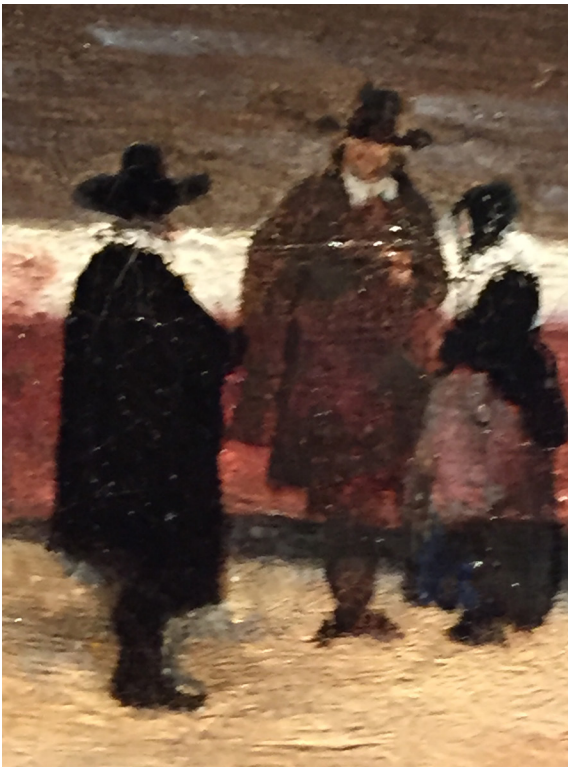
Fragment onbekende schilder

De volgende reeks observaties illustreert dit: