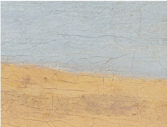
Fragment onbekende schilder

Beide kades behoren visueel op vrijwel gelijke hoogte boven de waterspiegel, evenwijdig aan het wateroppervlak te liggen. Dat is hier niet het geval. Het is alsof we vanaf een hoog standpunt op de gele kade neerkijken. Aan Vermeers overkant, wanneer we de blik richten op de basislijn van de Schiedamse Poort in het midden van het schilderij, ligt Delft ongeveer op ooghoogte; je kijkt tegen de stad aan alsof je op straat staat.