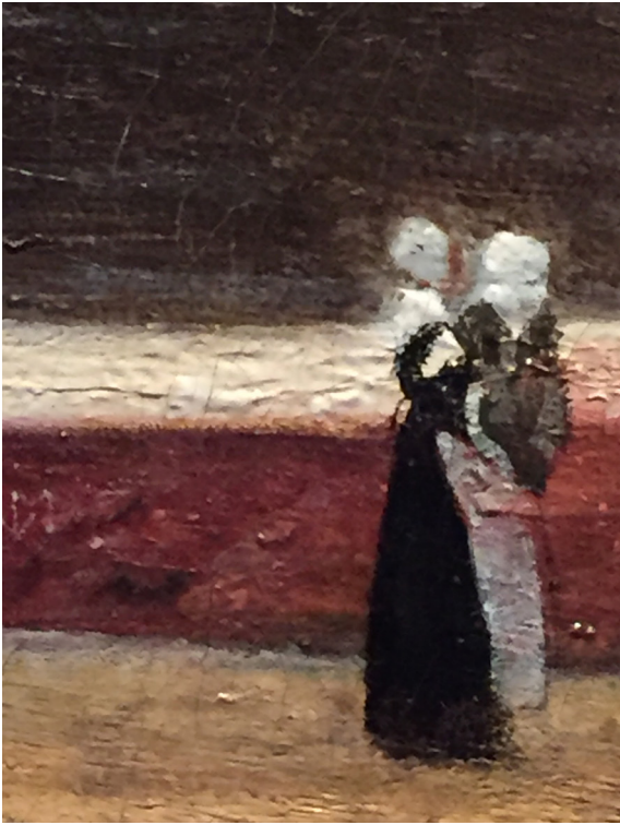
Fragment onbekende schilder