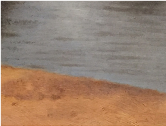
Fragment onbekende schilder

De twee schaduwloze paaltjes waaraan niet is te zien van welk materiaal zij gemaakt zijn, hebben, heel opvallend, de kleur van de oorspronkelijke waterspiegeling. Zij zijn vormloos, hebben geen strakke contouren en lijken omdat ze niet verankerd zijn in de zanderige grond los boven het kadeoppervlak te staan.