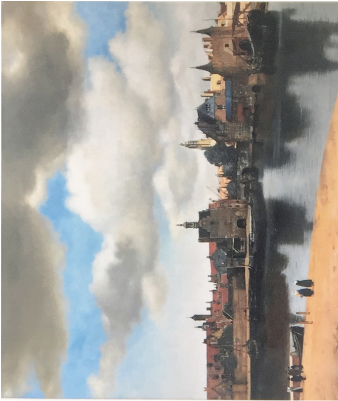
Gezicht op Delft, Johannes Vermeer