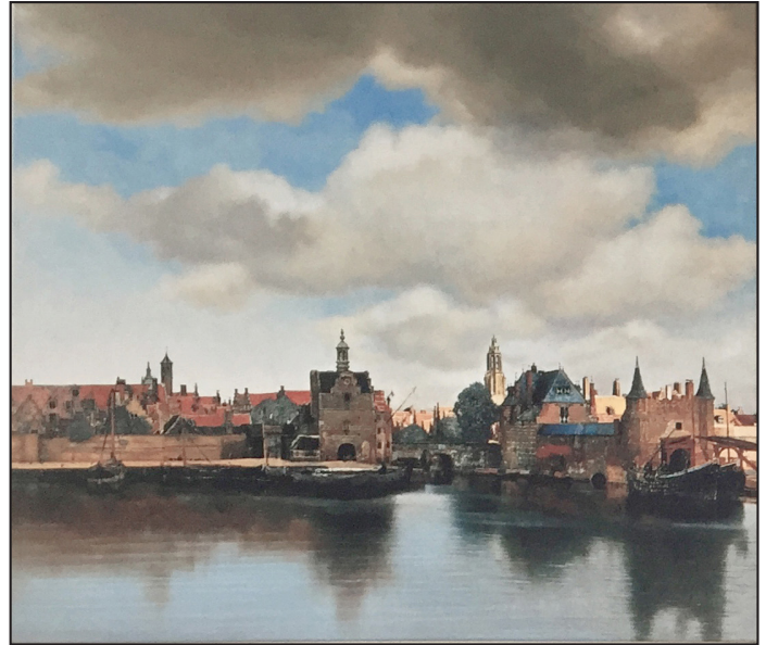
Licht op Delft, geschilderde reconstructie, Ton van Os

Vanaf deze twee vrouwen tot aan de spiegeling uiterst rechts in de hoek van het schilderij is goed te zien dat de waterspiegel niet lager ligt dan de kade. De grijsblauwe kleur van het water en de gele kleur van de kade hebben ongeveer dezelfde toonwaarde en lijken daardoor in elkaar over te gaan.