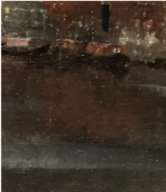
Fragment Johannes Vermeer

De ontdekking van dit verloren gegane beeld is schokkend. Vermeer staat bekend als een van de allergrootste kunstenaars en zijn Gezicht op Delft is een van zijn meest indrukwekkende werken. In de oorspronkelijke staat, ontdaan van die storende inbreuk, zou het werk des te meer beschouwd zijn als een hoogtepunt van de Nederlandse schilderkunst van de zeventiende eeuw en van de westerse kunstgeschiedenis.