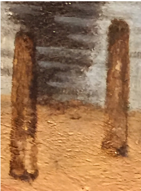
Fragment onbekende schilder

Door het keer op keer bekijken van deze plek ben ik me voor het eerst gaan afvragen of Vermeer wel de schilder van het gehele schilderij is en ben ik de onderkant van het schilderij net zo aandachtig gaan bekijken als de bovenkant.