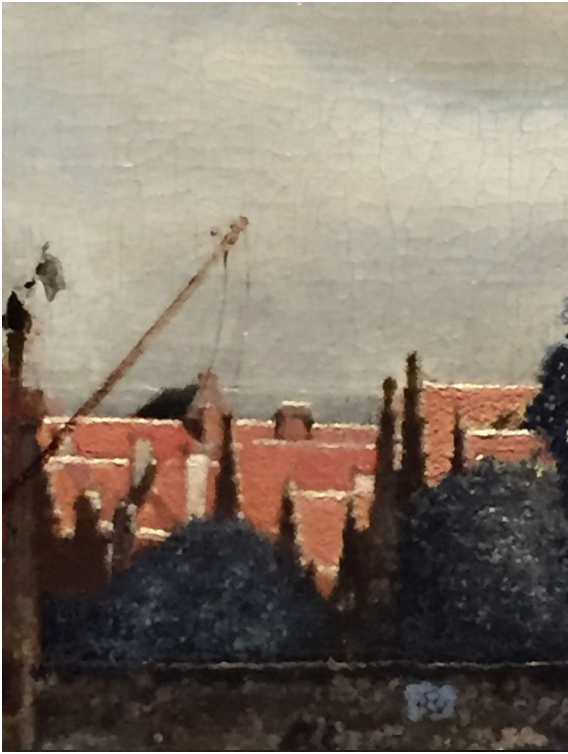
Fragment Johannes Vermeer

maar ook wordt het horizontale concept met drie evenwijdige banen van lucht, stad en water door de schuin oplopende voorgrond verstoord.