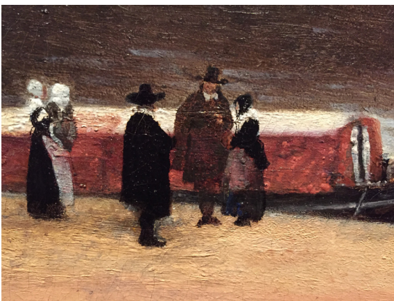
Fragment onbekende schilder

Er is nog meer aan de hand. De plaatsing van de trekschuit, personen en paaltjes blijkt bij nadere beschouwing niet willekeurig, maar als het ware gedictieerd te zijn door de bovenkant van het schilderij. Om dit inzichtelijk te maken heb ik op deze reproductie een aantal horizontale en verticale lijnen getrokken: