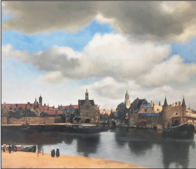
Gezicht op Delft, Johannes Vermeer