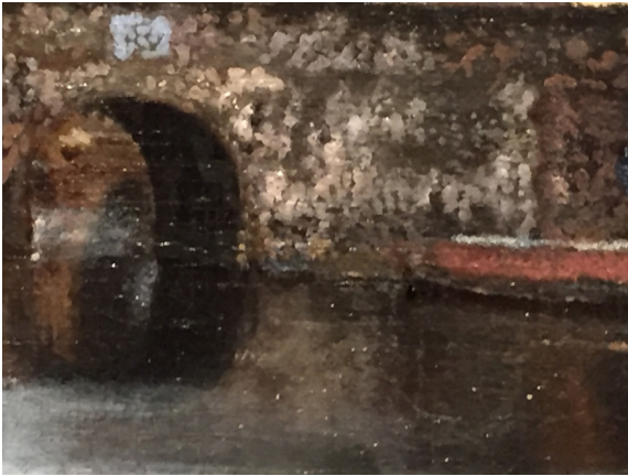
Fragment Johannes Vermeer

Er zijn wel sporen van leven waarneembaar op de kade aan de overkant, onder de poort van de klokkentoren en bij de boten, maar deze nauwelijks zichtbare aanwezigheid is opgenomen in de serene stilte die in Vermeers verfhuid bijna tastbaar is geworden.