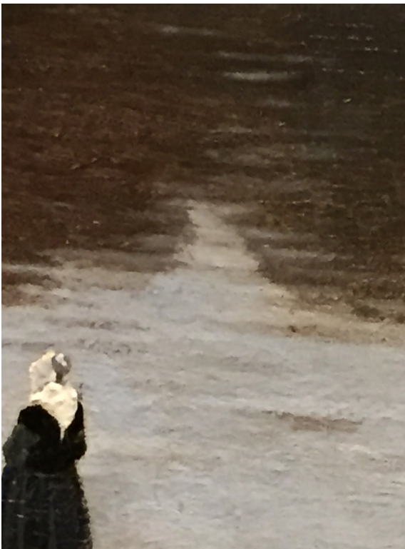
Fragment onbekende schilder

De doorschemerende grove verfstructuur van de achtergrond valt ook op bij de vormloos en schetsmatig geschilderde twee vrouwen aan de linkerkant. Het bovenlichaam van de achterste vrouw bevindt zich niet achter, maar naast de voorste vrouw, waardoor beide bovenlichamen op één onderlichaam lijken te staan. Is bij de eerste vrouw het gezicht slechts met een verticaal bruin vervlekje aangegeven dat wegvalt tegen de achtergrond, de vrouw half achter/naast haar heeft helemaal geen gezicht; het hoofdkapje en het gezicht zijn niet meer dan een vormloze vlek witte verf.