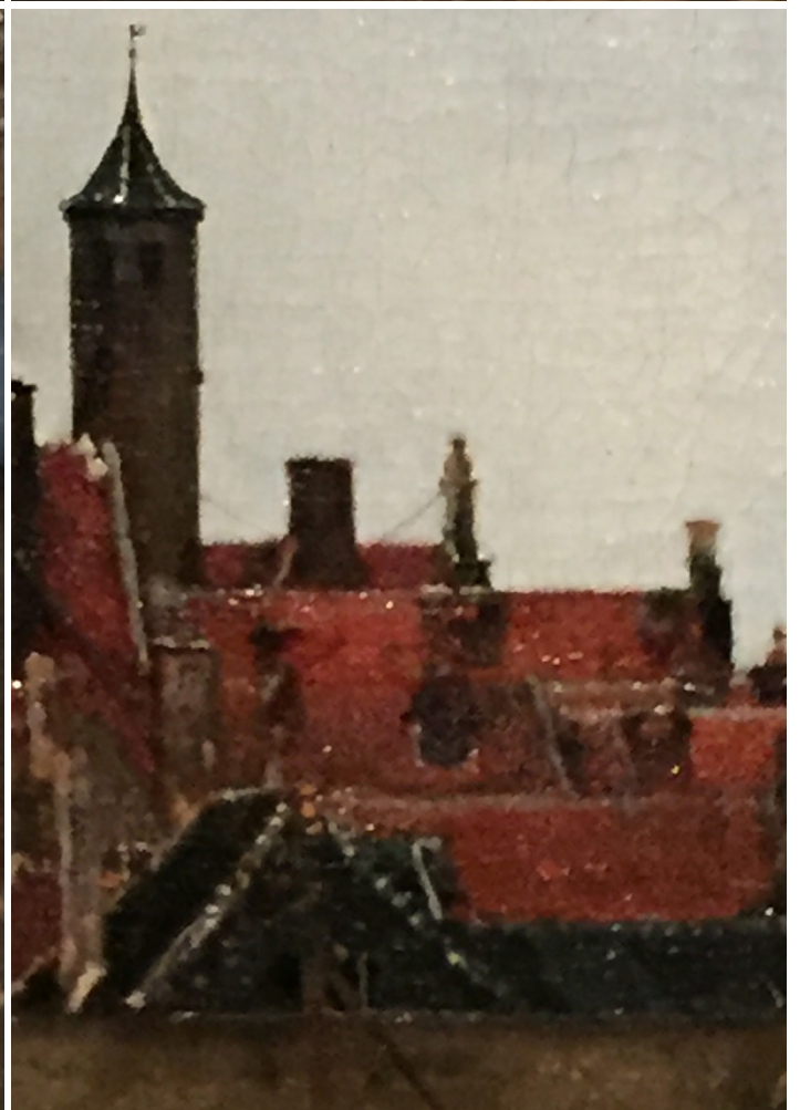
Fragmente Johannes Vermeer