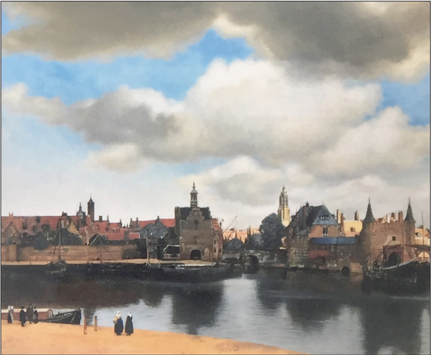
Gezicht op Delft, Johannes Vermeer