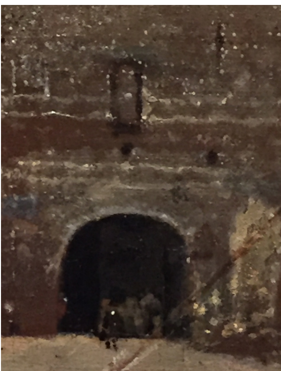
Fragment Johannes Vermeer

Op een op linnen gereproduceerde kopie van het schilderij heb ik het storende deel zo zorgvuldig mogelijk weggeschilderd en in de plaats daarvan het water zijn natuurlijke weerspiegeling over de gehele breedte teruggegeven. Dan verrijst tot in alle hoeken een onvergetelijk stralend visioen. Zo moet Vermeer het gewild hebben, en uitgevoerd. Het schilderij dat hem voor ogen stond, en dat hij ook voltooid heeft, had alles wat het Gezicht op Delft volmaakt maakte. Maar zo hebben wij het nooit leren kennen. Wij zien een Vermeer waaraan geknoeid is. De eenheid van het oorspronkelijke schilderij is onherroepelijk aangetast door de voorgrond die er aan is toegevoegd.