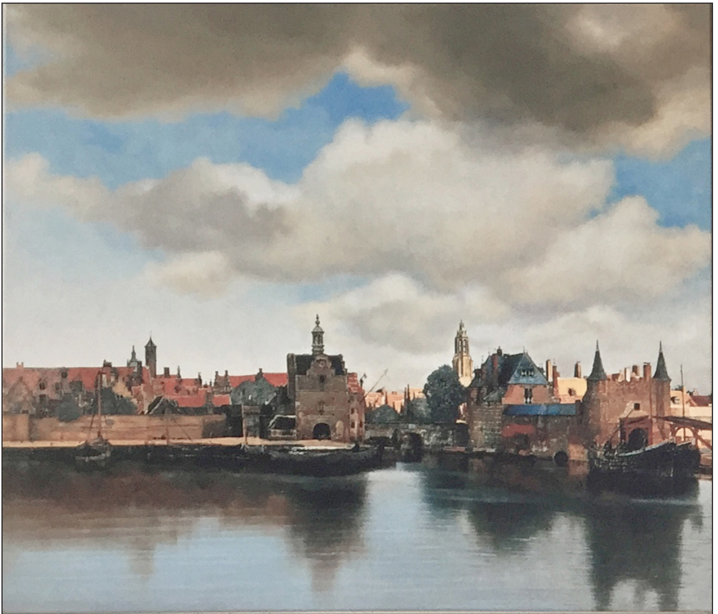
Licht op Delft , geschilderde reconstructie, Ton van Os