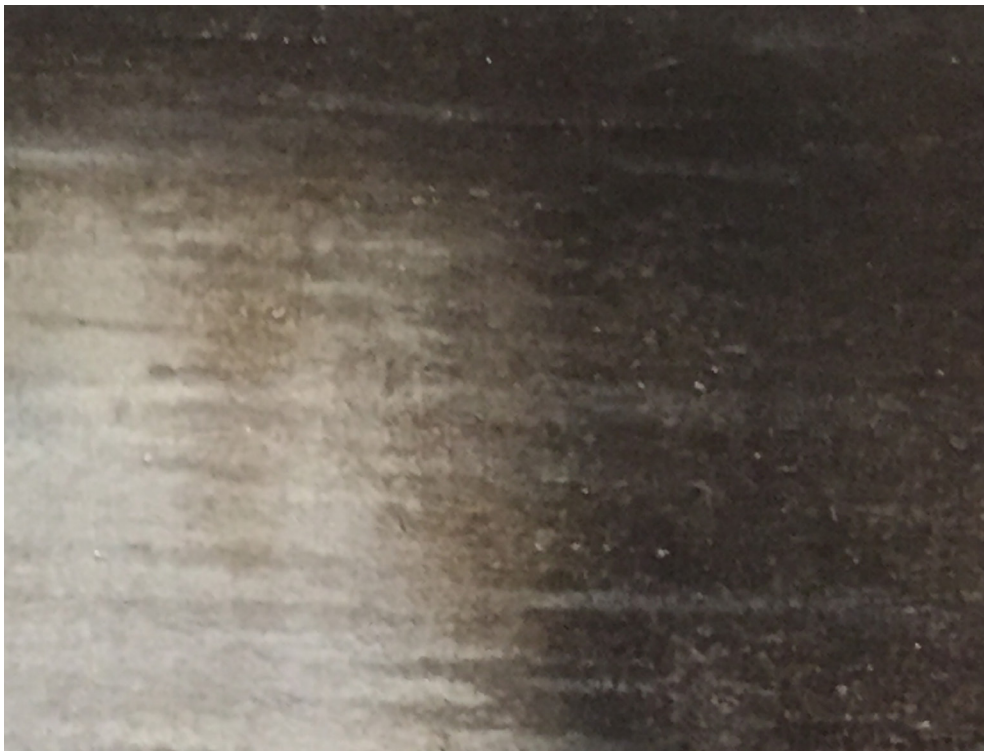
Fragment Johannes Vermeer

Op de klokkentoren is te zien dat het ongeveer acht uur in de morgen is. Uit het zuidoosten valt zonlicht op de daken van huizen in het centrum en vooral op de toren van de Nieuwe Kerk, terwijl het wolkendek de vooraan liggende huizen achter de stadsmuur in de schaduw legt. De doorbrekende zonnestrallen laten het stadje fonkelen als een edelsteen. Met zijn uiterst verfijnde techniek van los in elkaar geschilderde verftoetsen heeft Vermeer het licht op de stad voor de eeuwigheid vastgelegd. En door mijn geschilderde reconstructie kunnen we ons nu concreet voorstellen hoe dit horizontale stadssilhouet van donkere en zonbeschenen bouwwerken onder een wolkenlucht over de volle breedte in het water weerspiegeld werd. Een adembenemend nieuw gezicht: voornaam en ontroerend. Nogmaals: ontdaan van de toegevoegde anekdotiek is de verbeelding van Delft als een visioen. Dit schitterende schilderij dat ik de titel Licht op Delft zou geven bestaat niet meer. Het is voor altijd verloren gegaan.