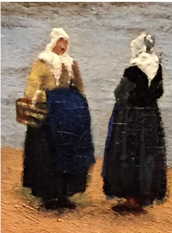
Fragment onbekende schilder

Het meest opvallende en storende aan de driehoek is de veel te lichte en branderige gele kleur. Wat de weergave van een bijna kleurloze hardstenen kade zou moeten zijn is een schaduwloze vlakke, overbelicht door een tweede lichtbron die detoneert bij de delicate schittering van Vermeers subtiel geschilderde zonlicht op Delft.